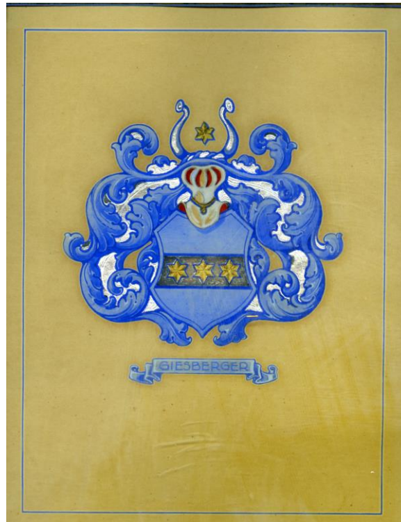
Wapen familie Giesberger