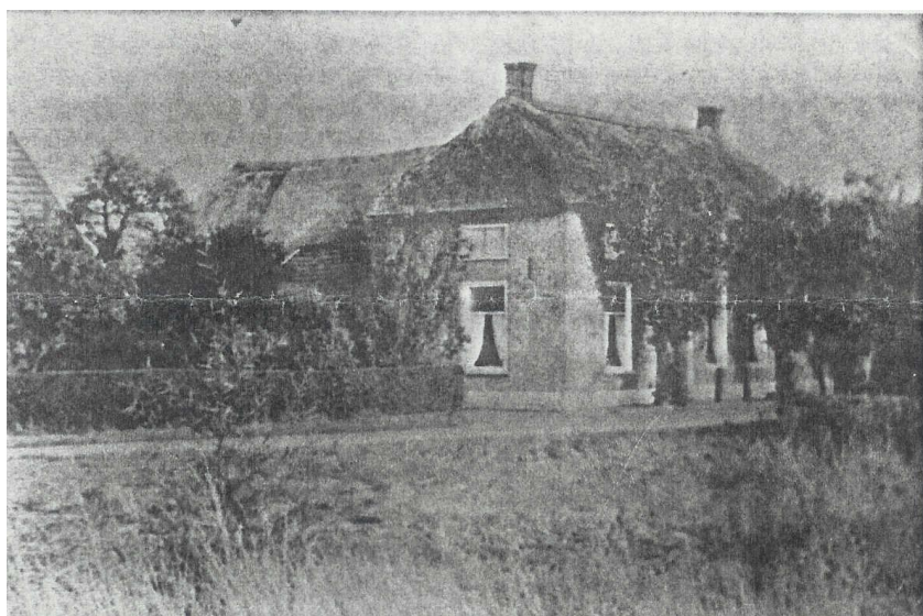
Herberg "De Prins"