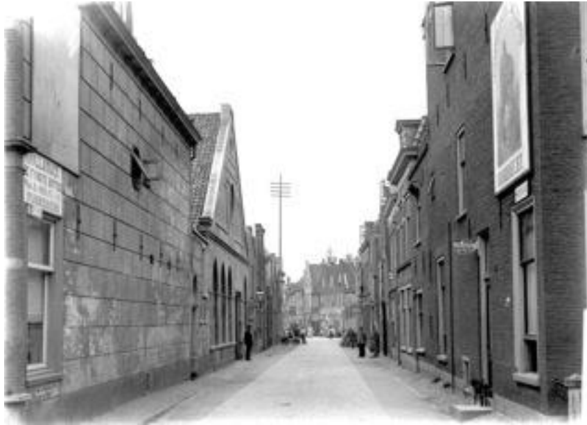
In het pand rechts, Narmstraat 1 te Leiden woonde Zeger als student