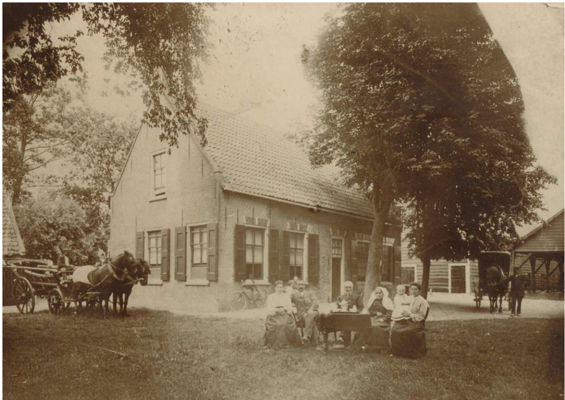
Boerderij Maije te Dreischor