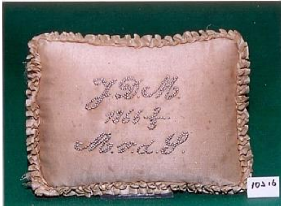
Gedenkkussen geschonken bij het huwelijk In bezit van Historisch Museum De Bevelanden te Goes